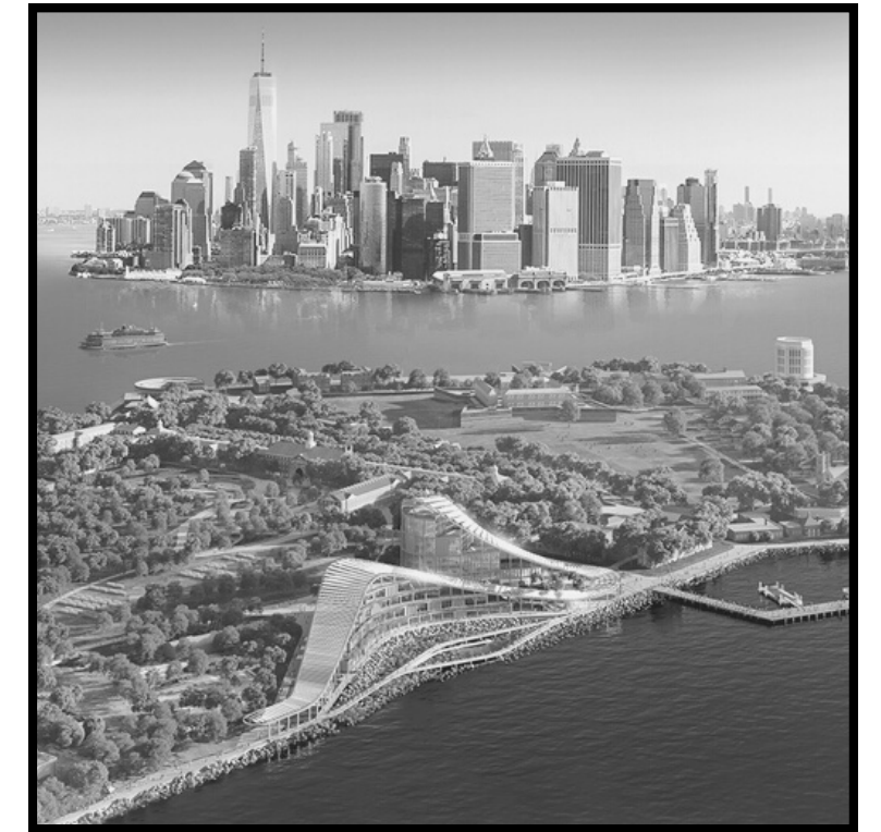
A rendering of what The Exchange facilities will look like when completed on Governor's Island / Una representación de cómo se verán las instalaciones de The Exchange cuando estén terminadas en Governors Island

GOLES sits on the advisory board and will help to develop community engagement efforts and programming.