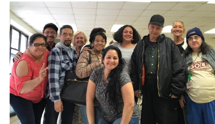
GOLES Healthy Aging Program (GHAP) participants along with GOLES staff. See above for information about upcoming workshops. /Miembros del Programa de Envejecimiento Saludable de GOLES, junto a personal de GOLES, después de un taller. Arriba están los detalles sobre los próximos talleres.