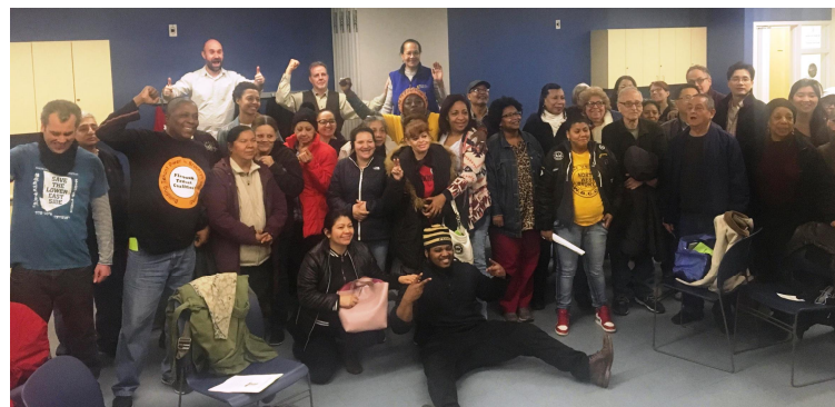
17 groups and dozens of tenants for all over the city got together in March continue to build the recently created Citywide Tenant Union/17 organizaciones e inquilinos de toda la ciudad se reunieron en Marzo para desarrollar la nueva Coalición de Inquilinos de NYC

Después de las introducciones y juegos, todos se dividieron en grupos más pequeños y discutieron asuntos de vivienda importantes, como el acoso sistemático que sufren muchos inquilinos y el hecho que los caseros muchas veces no hacen reparaciones necesarias. →